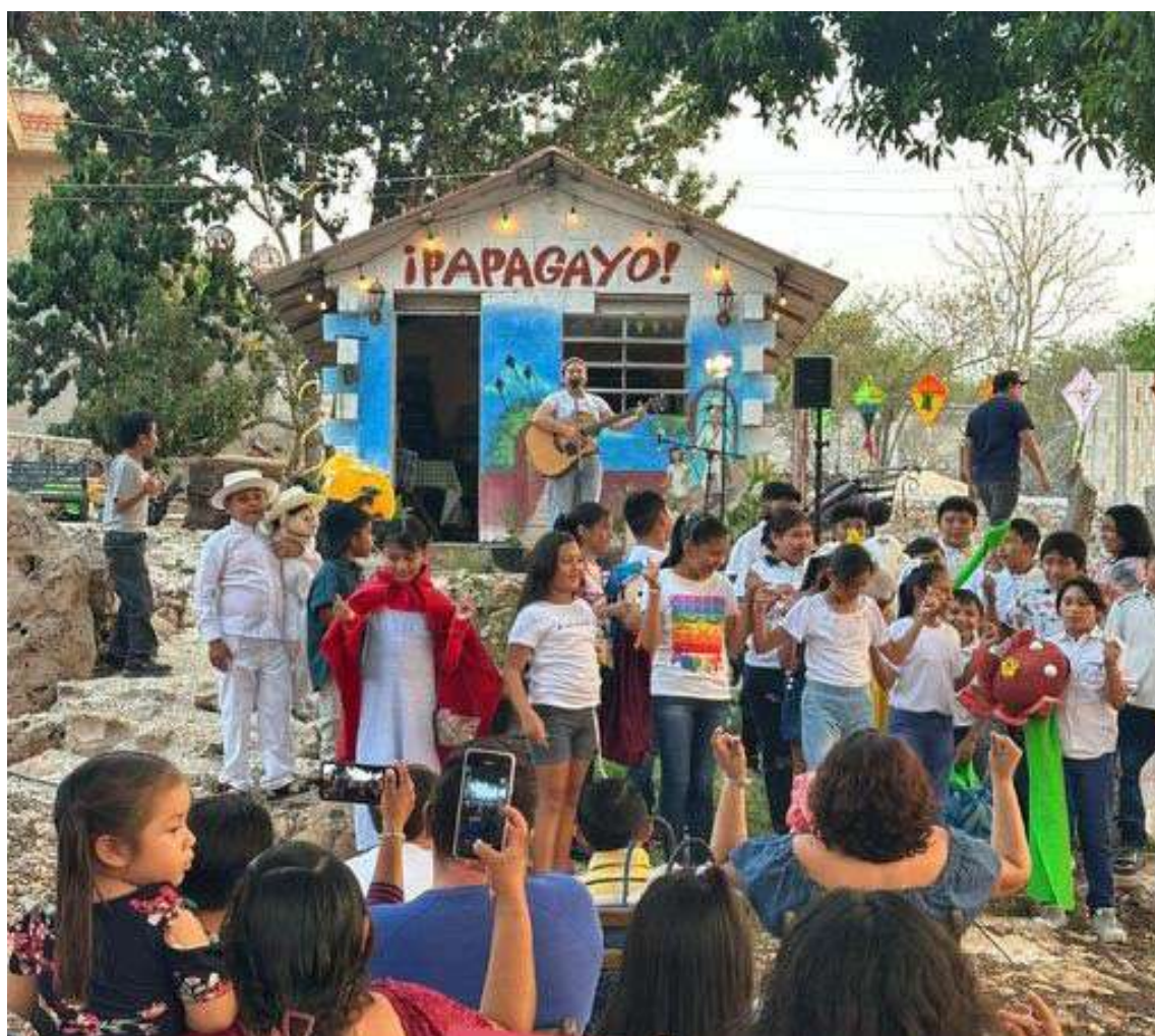
Biblioteca Papagayo, Escuela José Andrés Espinosa Colonia, de Oxkutzcab, Yucatán.

Entonces se produce un gran conflicto, desde el director que no lo acepta, o el maestro que no lo integra