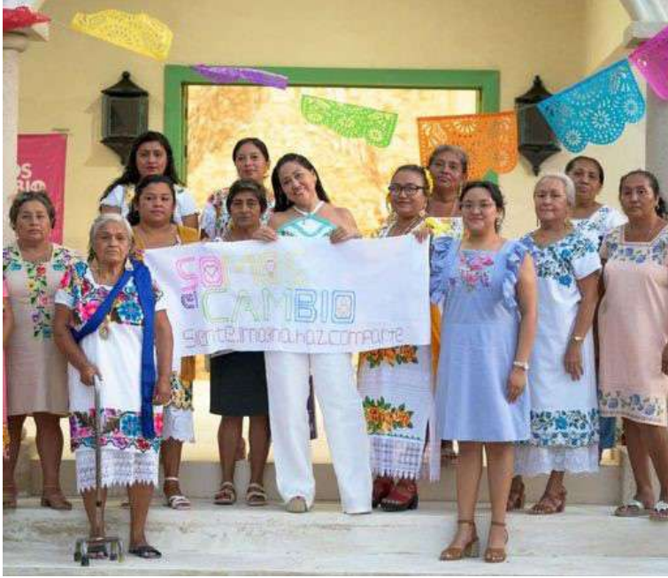
La casa del Xokbil Chuuy, Colectivo, Tecoh, Yucatán.

proyectos. El tutor es el que lleva realmente la carga del proyecto, el que está haciendo todo.