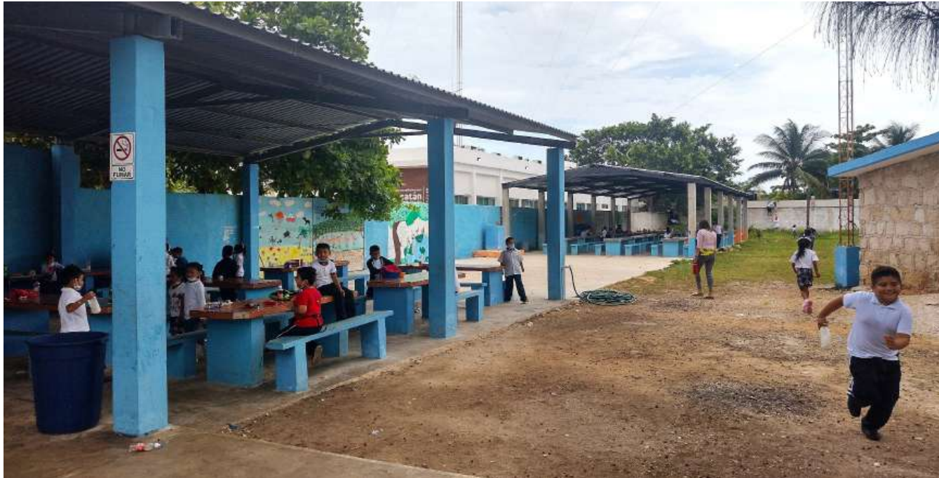
Los espacios de convivencia son fundamentales para la formación de comunidades armónicas.

“Se busca iniciar la reflexión y el fomento de la cultura de la prevención... porque una comunidad que previene es una comunidad que se preocupa y que actúa de manera eficiente”.