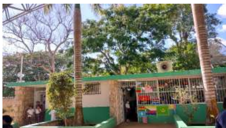
La escuela es una comunidad y se busca fortalecer la cultura de la prevención.

Con este proyecto se busca iniciar la reflexión y el fomento de la cultura de la prevención, de estar preparados antes de que los hechos ocurran y no actuar o tratar de resolver al momento de las crisis, porque una comunidad que previene es una comunidad que se preocupa y que actúa de manera eficiente. A su vez, se considera el punto de partida para poder establecer los lineamientos para que en cada escuela se registren los hechos o eventos que se consideren como crisis y tener datos reales de lo que ocurre día a día en las escuelas.