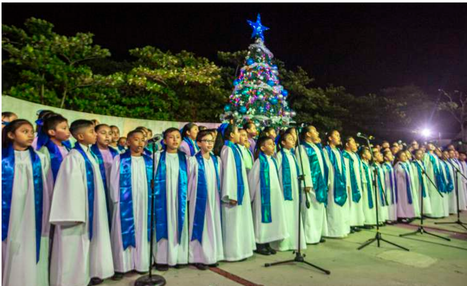
Ceremonia de Encendido del Árbol Navideño de la SEGEY, con la participación del Coro "Uniendo Voces", integrado por alumnos de Educación Primaria.

Alumna del Tercer Grado Grupo A Escuela Secundaria Estatal "General Salvador Alvarado"