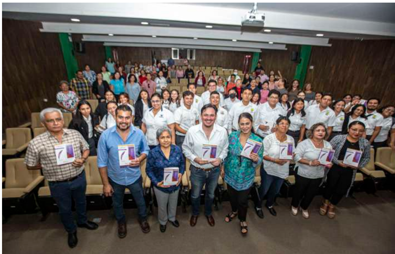
Fotografía de Hugo Borges. Archivo Comunicación Social-SEGEY.