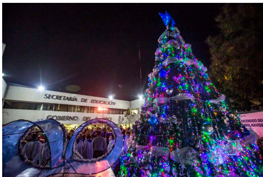
La Estrella de Navidad luce en el Árbol de la SEGEY.

Alumna del Tercer Grado Grupo A Escuela Secundaria Estatal “General Salvador Alvarado”