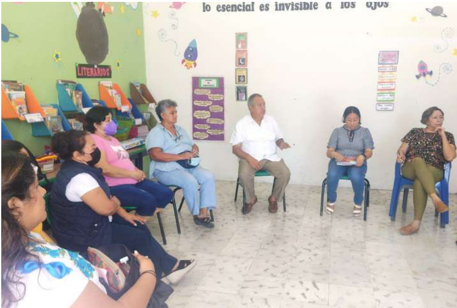
Reunión de trabajo del Protocolo Escolar de Respuesta a Crisis en Yucatán (PERCRY).