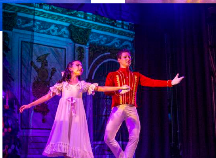
Imágenes de "El Cascanueces", interpretado por las y los alumnos del Centro Estatal de Bellas Artes.