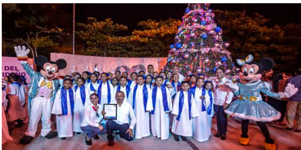
Navidad en SEGEY.

Alumna del Tercer Grado Grupo B Escuela Secundaria Estatal "Joaquín Coello Coello"