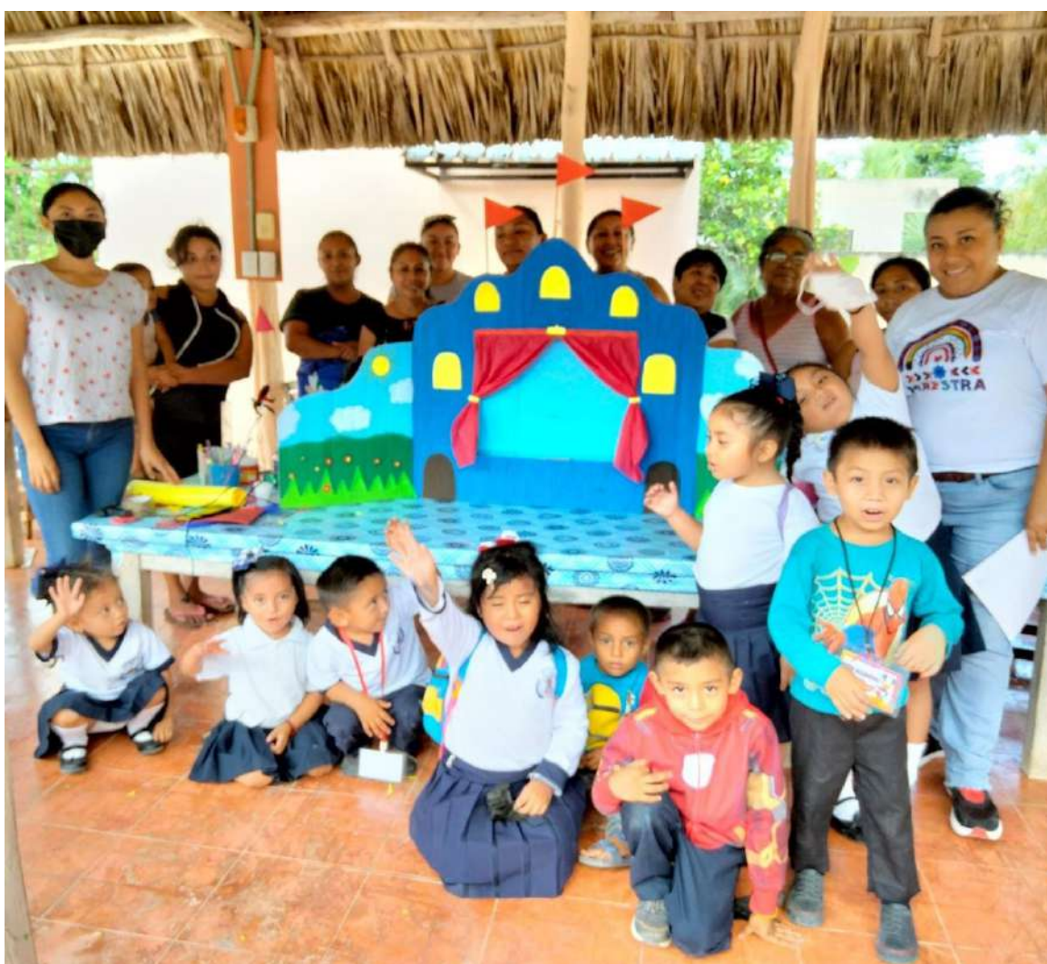
Alumnos y padres de familia intervienen en las actividades que realizan los GPM.

"Hacerle saber a mi hijo que es importante para mí y que compartir con él me hace sentir feliz" (SIC).