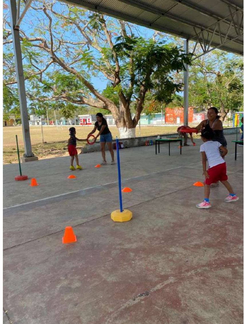
Implementación de la estrategia didáctica "Exatlón de las vocales" como parte del trabajo colaborativo entre el docente y el Guía Pedagógico Multigrado (GPM) durante el proceso de acompañamiento pedagógico del ciclo escolar 2023-2024.