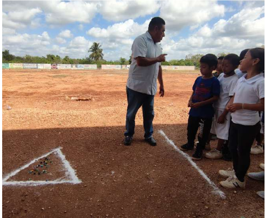
Implementación de metodología basada en proyecto para el fortalecimiento de los contenidos temáticos multigrado; la vinculación, la transversalidad, el tema en común, actividades diferenciadas, gradualidad, diseño de consignas y propósitos, como parte del trabajo colaborativo entre docente y Guía Pedagógica Multigrado (GPM).

rúbricas, el uso e implementación de metodologías por proyectos, entre otros aspectos. Si bien, esto se pudiera ver como un trabajo cotidiano y sin complicaciones, al tener otras responsabilidades aparte del grupo, a veces nos hace perder el enfoque y objetivo por el cual estamos en las escuelas, estar frente a grupo y a partir de ello, que los niños y niñas se desarrollen de manera integral.