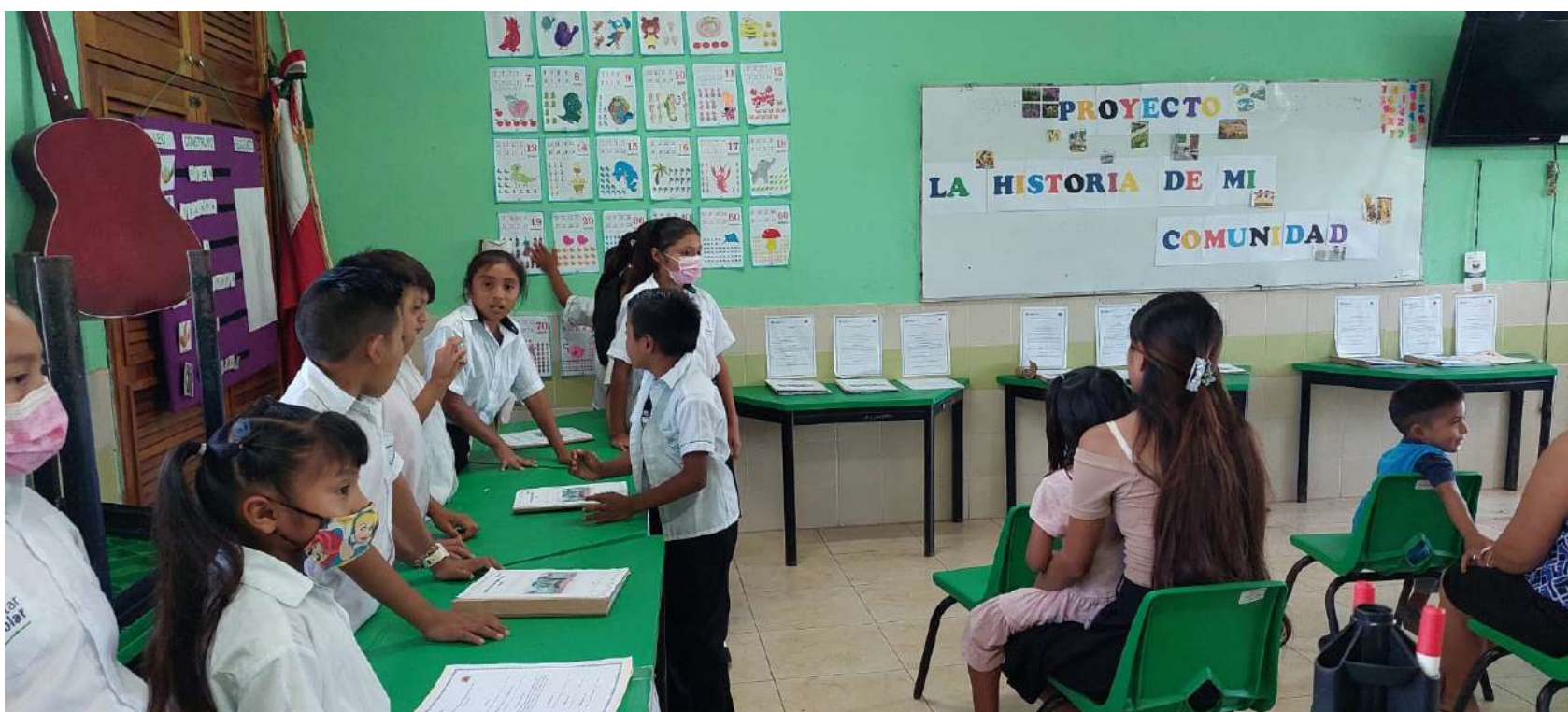
Habilitación de espacios escolares en abandono para fines pedagógicos de la Escuela Primaria Indígena "Rafael Ramírez Castañeda".

Flores, H. (2021). La gestión educativa, disciplina con características propias. La gestión educativa, disciplina con características propias. Dilemas contemporáneos: educación, política y valores , 9(1), 00008. Epub 3 de noviembre de 2021. https://doi.org/10.46377/dilemas.v9i1.2832 .