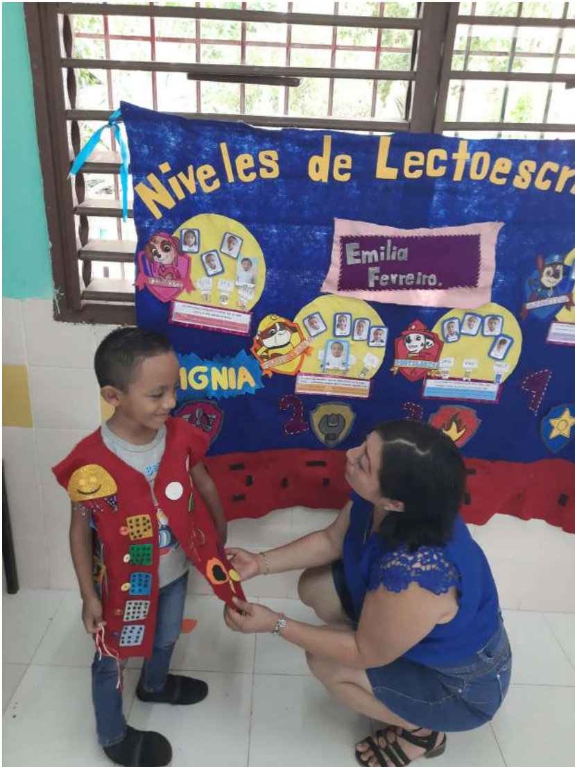
La participación directa del Guía Pedagógico Multigrado permite generar estrategias de atención directas a las necesidades registradas en cada centro escolar.

¿Es posible la gamificación sin el uso de recursos tecnológicos? Para poder responder a esta interrogante debemos comprender el término gamificación. El concepto de gamificación surge en el año 2002 pero su uso se extendió hasta el año 2010. En un sentido tecnológico, Deterding (2011) menciona que surge de la adopción de los videojuegos y su metodología competitiva.