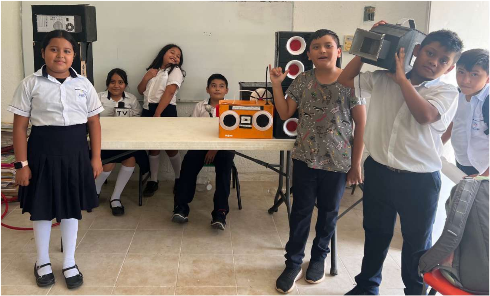
Material didáctico "LA RADIO" diseñado e implementado en la Esc. Prim. Ind. Julio De La Fuente con C.C.T. 31DPB0256P.