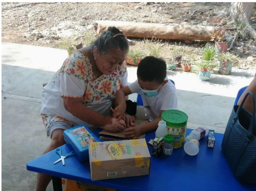
Fortalecer el involucramiento de los padres de familia en escuelas multigrado durante la implementación de las secuencias didácticas.

Uno de los principales aspectos abordados y fortalecidos fue el de la planeación didáctica, utilizando y aplicando