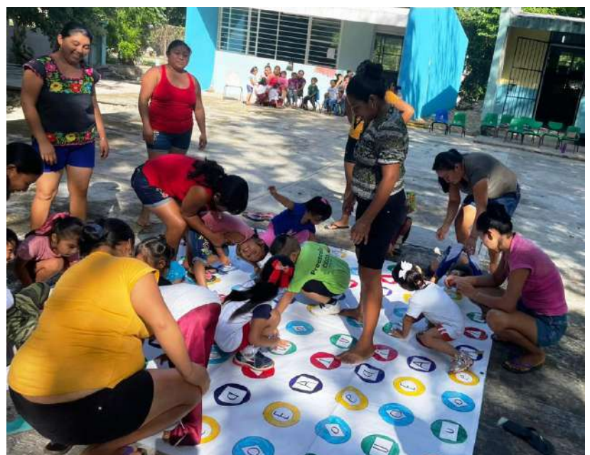
Participación de familiar en la implementación de la estrategia didáctica "Twister".