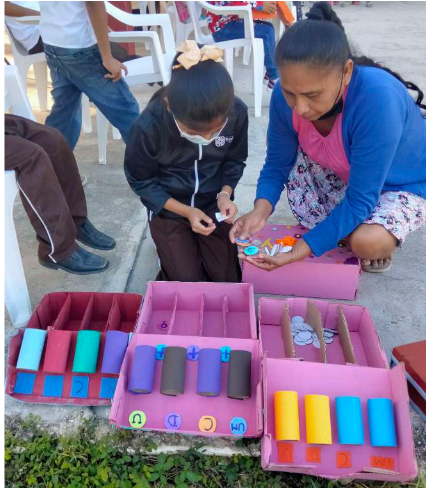
El Guía Pedagógico Multigrado (GPM) brinda apoyo a los docentes de escuelas multigrado para el diseño e implementación de materiales didácticos que fortalezcan la práctica docente.

Por otra parte, se ha demostrado que los dispositivos de formación fundados en el aprendizaje autónomo, horizontal y colaborativo resultan más efectivos para lograr el cambio de las prácticas de enseñanza, ya que permiten probar nuevas estrategias didácticas, contextualizarlas y analizar las dificultades que se presentan en los escenarios reales a medida que ocurren, buscando que el docente se involucre de manera voluntaria, sin necesidad de obligar o condicionar su participación en el proceso de intervención. Por consiguiente, el acompañamiento pedagógico in situ es una alternativa superadora de los modelos de formación permanente de carácter instrumental y carencia basada en cursos puntuales, masivos, homogéneos y en la transmisión unilateral (expertos y especialistas) de conocimientos, ya