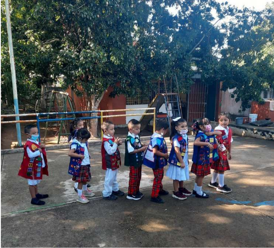
Implementación de la estrategia didáctica "Chaleco explorador" en la Esc. Preescolar Indígena "Kukulcán" con C.C.T. 31DCC0140K, como parte del ciclo de acompañamiento pedagógico 2023-2024.