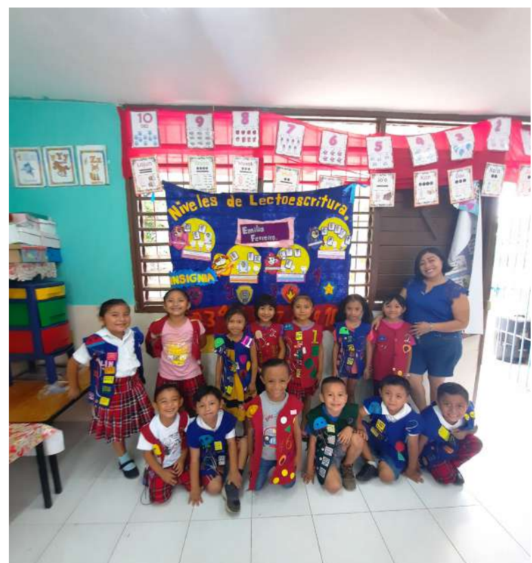
Alumnos de la Escuela Preescolar Indígena "Kukulcán", después de realizar la estrategia didáctica "Chaleco explorador".

"Sí es posible aplicar la gamificación sin recursos tecnológicos, ya que gamificar no implica tecnología necesariamente, sin embargo, sí requiere imaginación, innovación, creatividad y sobre todo vocación".