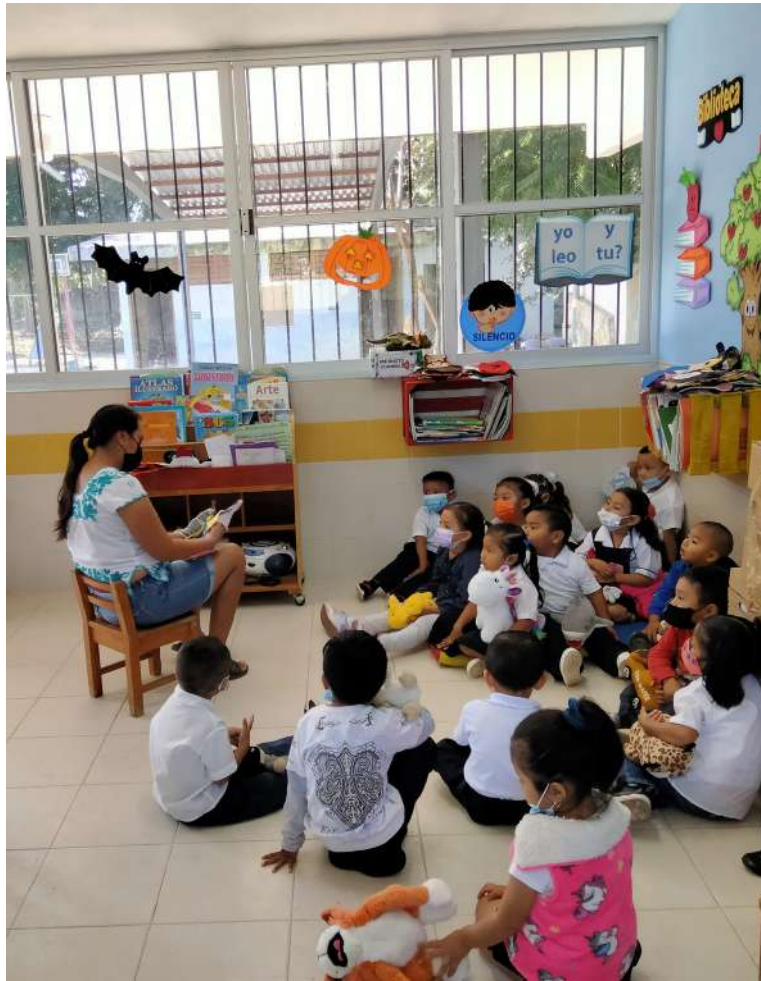
Rincón de lectura y calma "Mis amigos los libros" de la Escuela Preescolar Indígena "Augusto Alberto Cárdenas Pinelo" con C.C.T. 31DJN20550.

recursos, que generan procesos participativos en beneficio de la comunidad..." (p. 81).