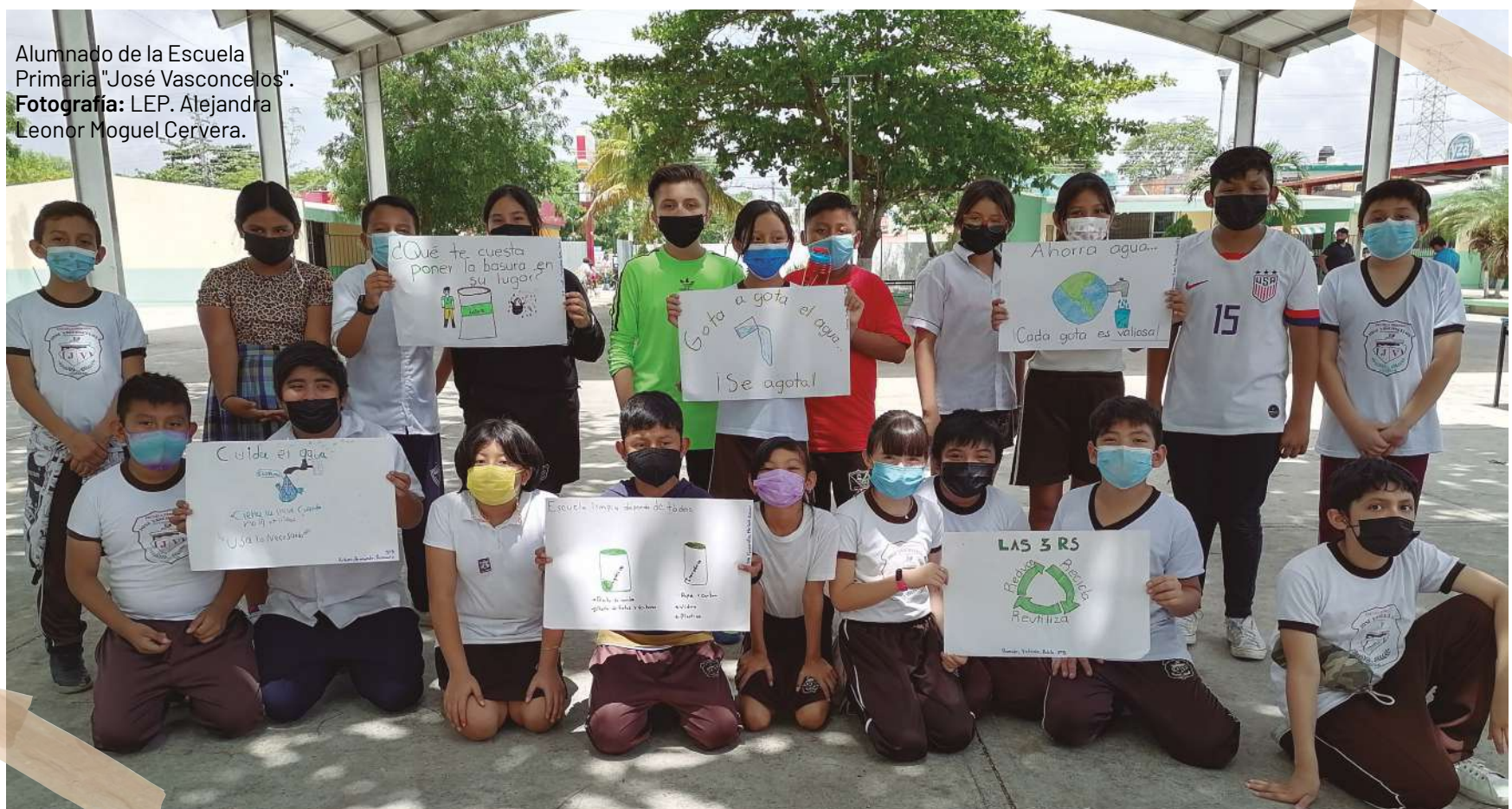
Alumnado de la Escuela Primaria "José Vasconcelos".

El presente artículo está ilustrando con imágenes de algunas actividades realizadas por los alumnos y alumnas del 5to “B” de la Escuela Primaria “José Vasconcelos”, ubicada en oriente de la Ciudad de Mérida, fraccionamiento Vergel III, en las cuales reconocieron problemáticas, identificaron sus causas, analizaron las consecuencias, establecieron soluciones y compartieron con la comunidad escolar mediante carteles y folletos.