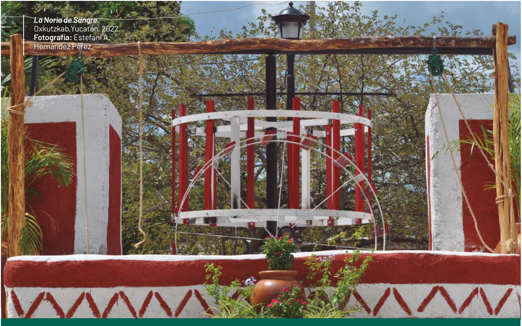
La Noria de Sangre. Oxkutzkab, Yucatán, 2022.