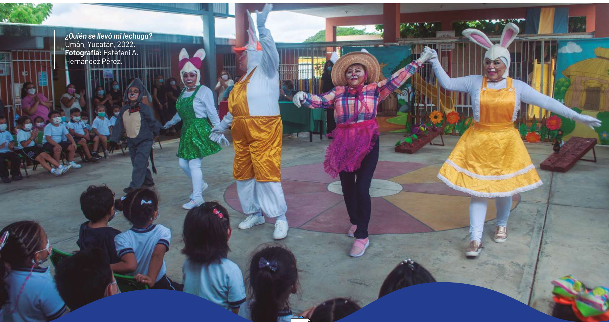
¿Quién se llevó mi lechuga? Umán, Yucatán, 2022.