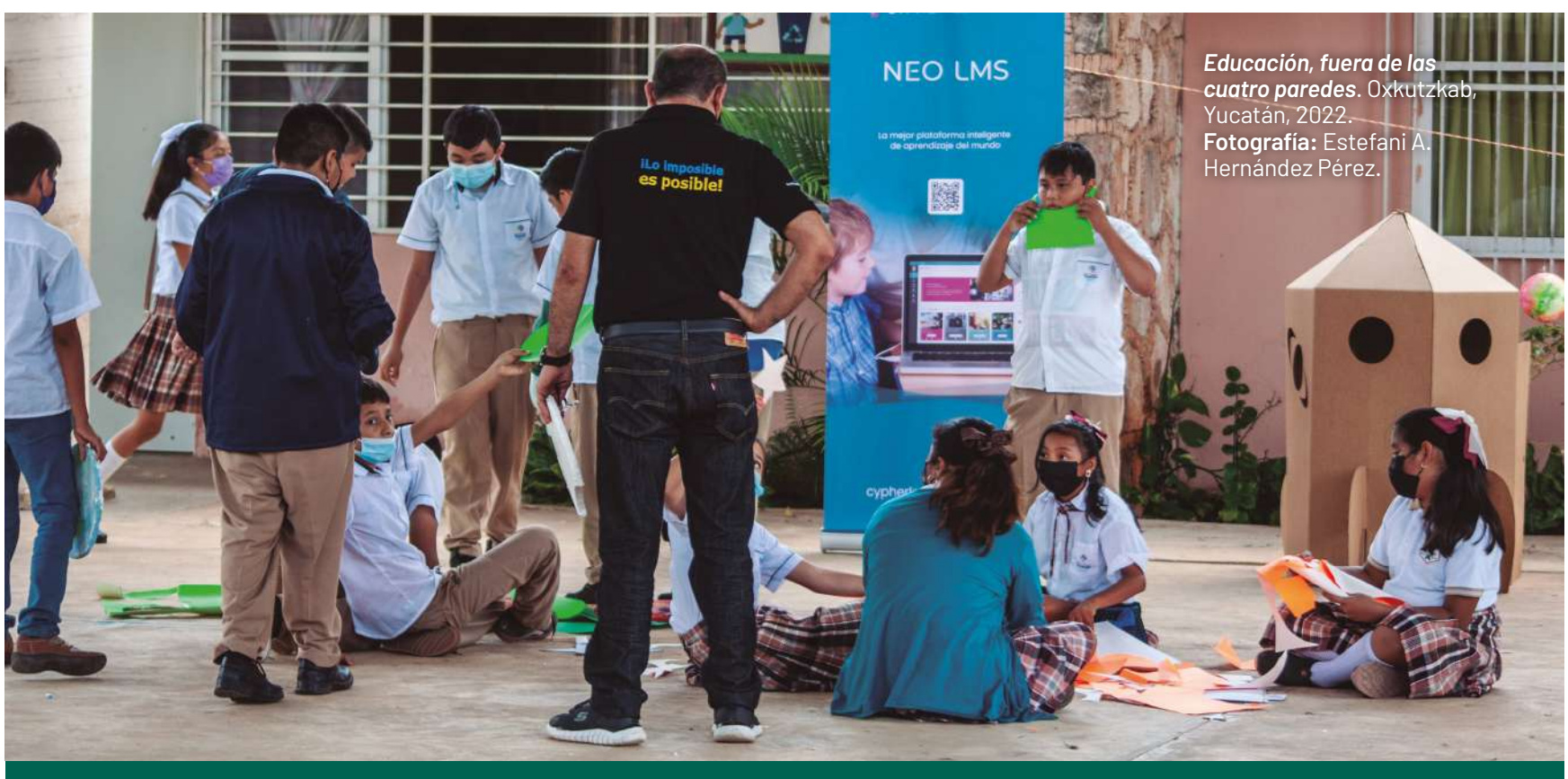
Educación, fuera de las cuatro paredes. Oxtutzkab, Yucatán, 2022.

• Uno de los lemas de esta filosofía es “porque te di alas de libertad que nada ni nadie te detenga” , es decir, tienen la libertad de crear y hacer. Mis alumnos y alumnas se sienten capaces de resolver los problemas o retos que se les presenten. •