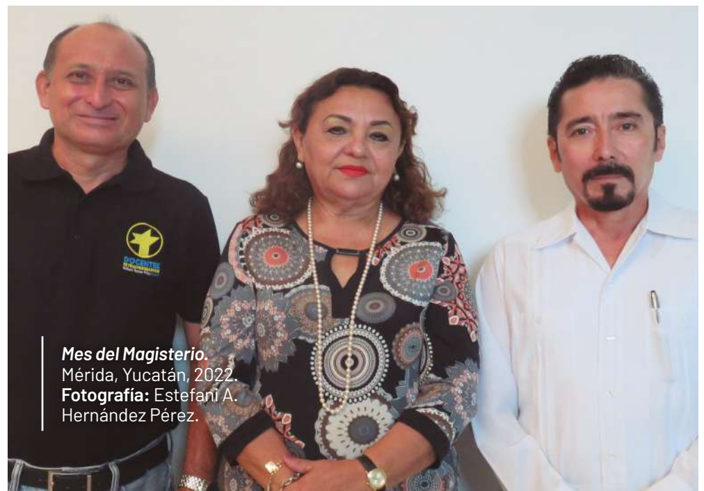
Mes del Magisterio. Mérida, Yucatán, 2022.

Para cerrar la velada, los estudiantes de la Escuela Secundaria "Serapio Rendón", presentaron el Trío Ma'fara, que compartió tres melodías dedicadas a los valores de amistad, amor y vocación que forman parte de la vida y de la actividad magisterial.