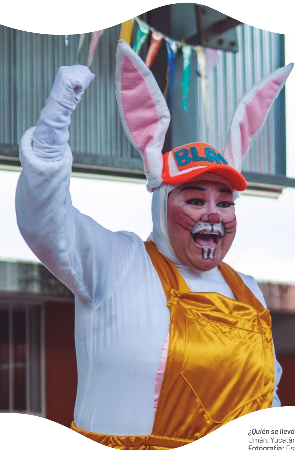
¿Quién se llevó mi lechuga? Umán, Yucatán, 2022.