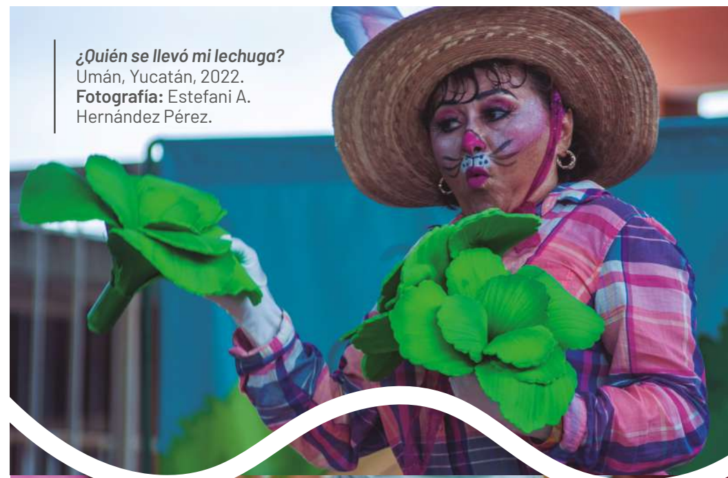
¿Quién se llevó mi lechuga? Umán, Yucatán, 2022.

Al ser las manifestaciones artísticas representaciones de los sentidos y las percepciones humanas, su utilidad en la educación es justa de reconocer, más todavía después de los años de angustia que hemos vivido en el mundo por la Covid-19, por ello, celebramos que mediante el teatro se refuercen valores y conocimientos tan importantes, como los que disfrutamos en una mañana llena de arte .