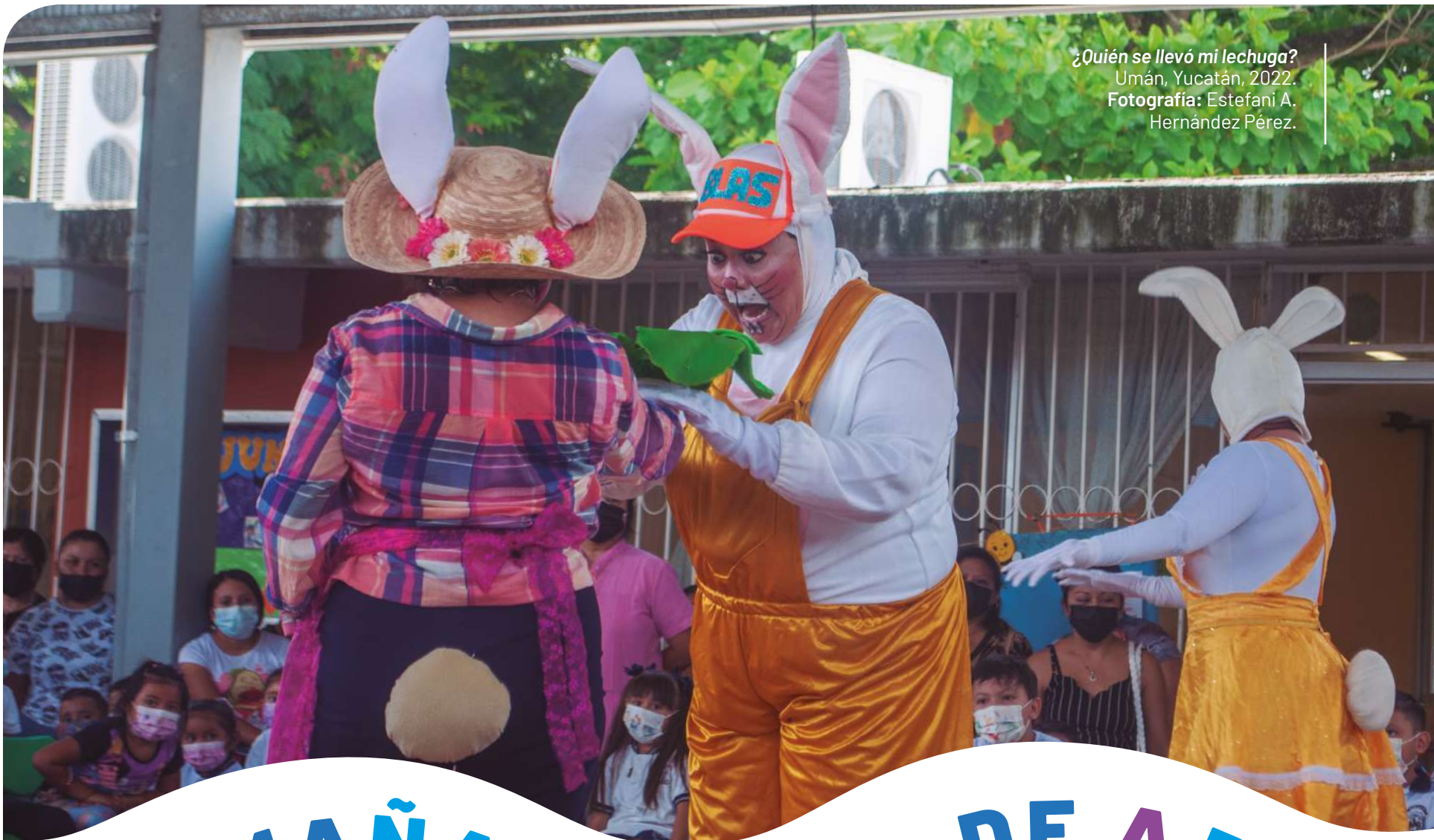
¿Quién se llevó mi lechuga? Umán, Yucatán, 2022.