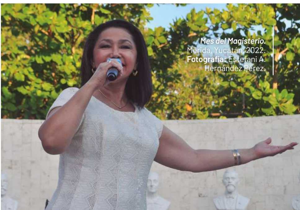
Mes del Magisterio. Mérida, Yucatán, 2022.