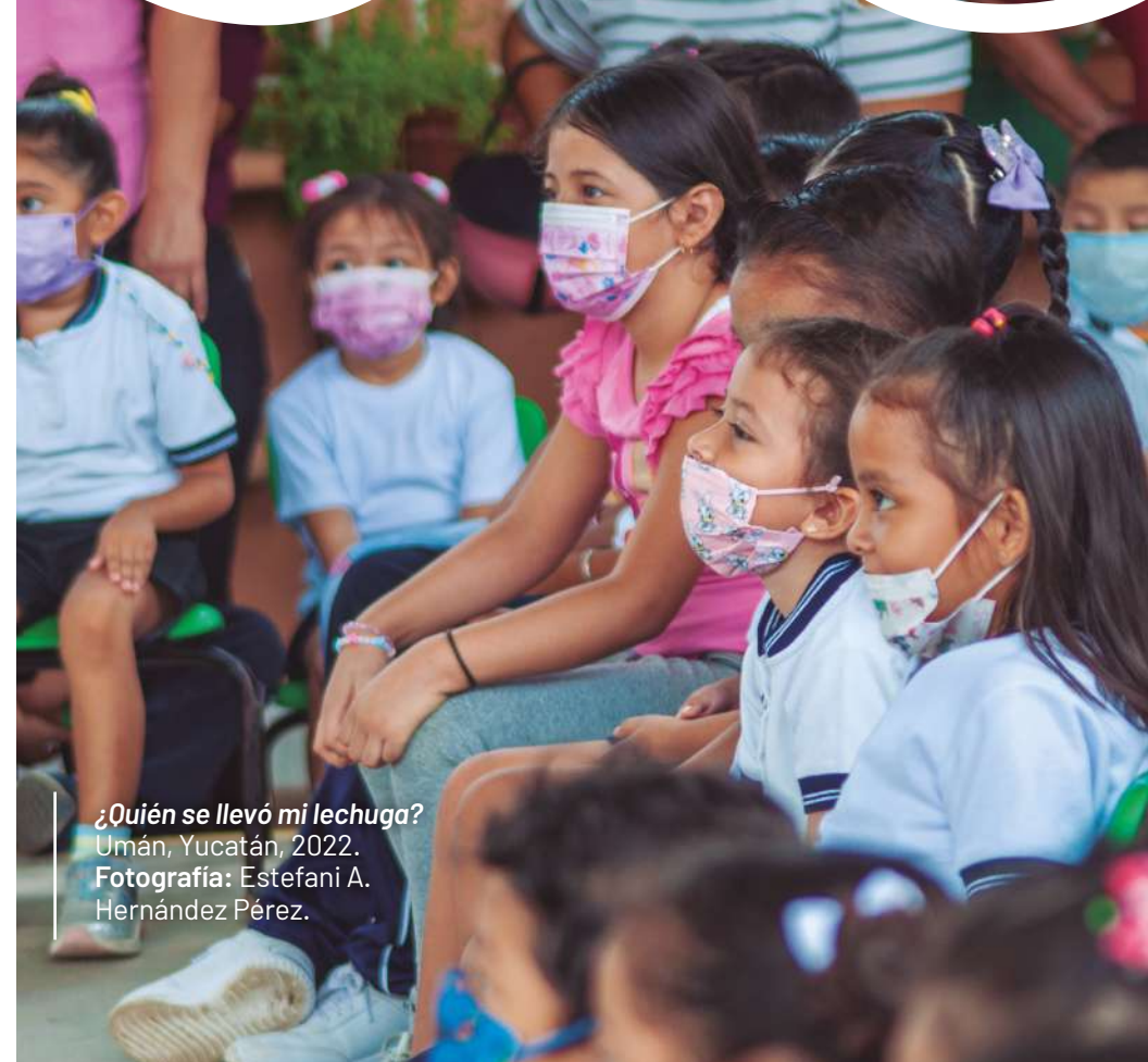
¿Quién se llevó mi lechuga? Umán, Yucatán, 2022.