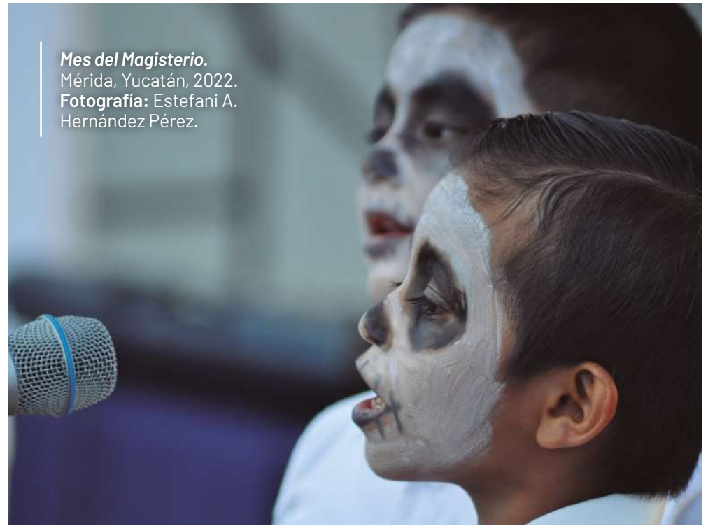
Mes del Magisterio. Mérida, Yucatán, 2022.

En el segundo día de actividades (jueves 12 de mayo), se presentaron actividades artísticas y culturales dedicadas a reconocer la labor docente. Fueron los alumnos y alumnas de diferentes centros escolares quienes dedicaron sus actuaciones a homenajear a sus profesoras y profesores. La velada inició con la participación musical del Jardín de Niños