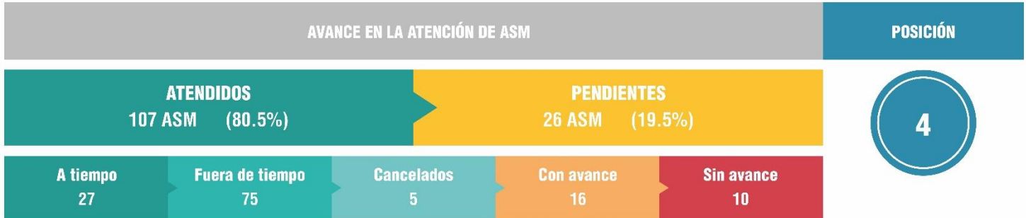
Estatus de atención de los ASM por tipo de intervención pública, SEGEY